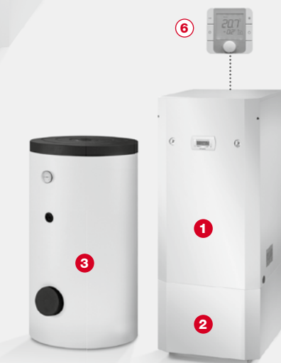
Widok pakietu po zestawieniu komponentów