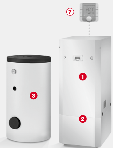
Widok pakietu po zestawieniu komponentów