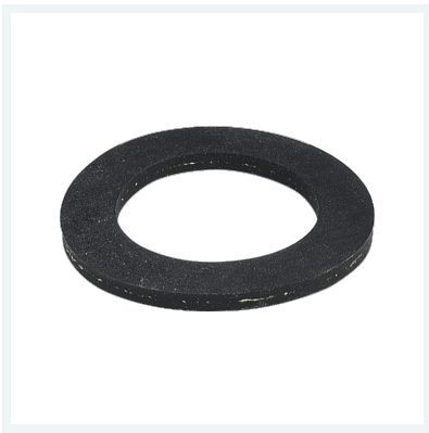
Uszczelka płaska nr wzoru 9953ME