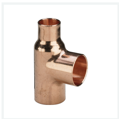
Trójnik - przyłącza lutowane nr wzoru 95130