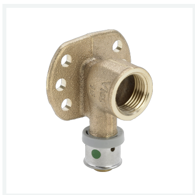
Pexfit Pro-kolanko ze złączką ścienną z SC-Contur nr wzoru 4725.5 nr kat. 608 262