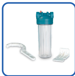
Kompletny zestaw filtracji wstępnej