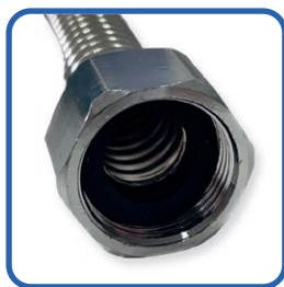
Wąż przyłączeniowy 3/4"