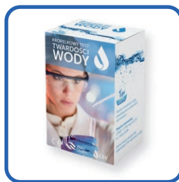
Kropelkowy test twardości wody