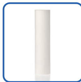
Wkład z włókny polipropylenowej