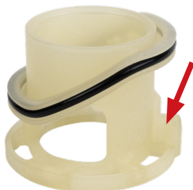
Рис. 1. Направляющий выступ на смесительном элементе

Направляющий выступ на смесительном элементе (Рис. 1) должен быть помещен в специально подготовленный желоб внутри клапана (Рис. 2). Только такая установка (Рис. 3) гарантирует правильную работу клапана.