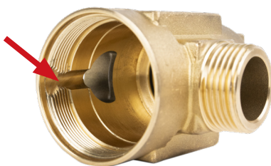
Рис. 2. Желоб внутри клапана