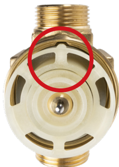
Рис. 3. Правильно установленный комплект